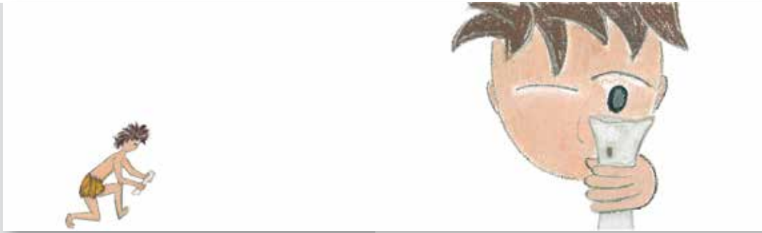
Figura 2: O personagem encontra o osso e o examina (p.8, 12).