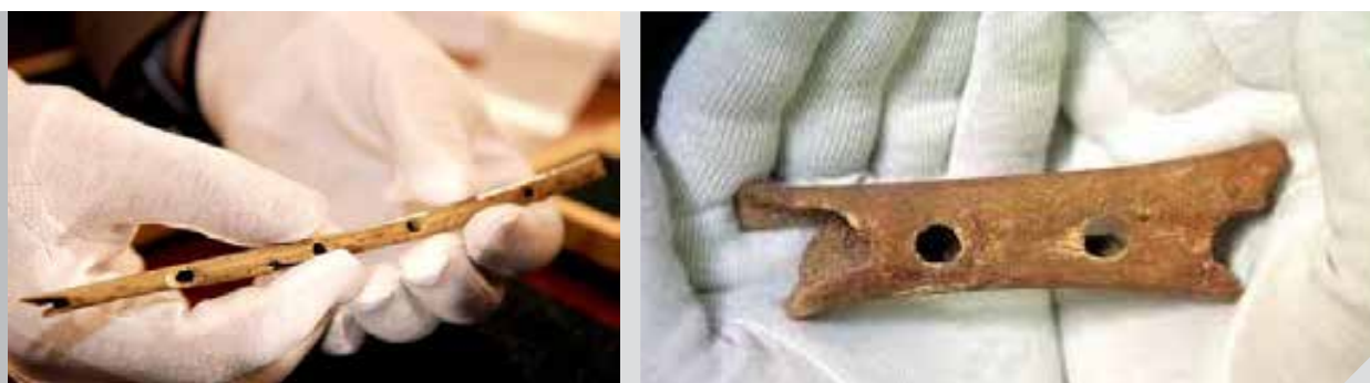
Figura 1: fragmentos de flautas esculpidas em osso de abutre e de urso, respectivamente, encontrados na caverna HohleFels, na Alemanha.

Nosso ideário a respeito da música pré-histórica é povoado por sons vocais, corporais, percussão de bastões e outros objetos. Menos conhecida é a existência também de instrumentos de sopro. Na última década foram encontrados fragmentos de flautas de 35 mil anos feitas de marfim de mamute e de ossos de aves e de urso (figura 1). Esses artefatos possuem orifícios semelhantes aos das flautas modernas, o que sugere que os homens primitivos já produziam “melodias” explorando diferentes alturas.