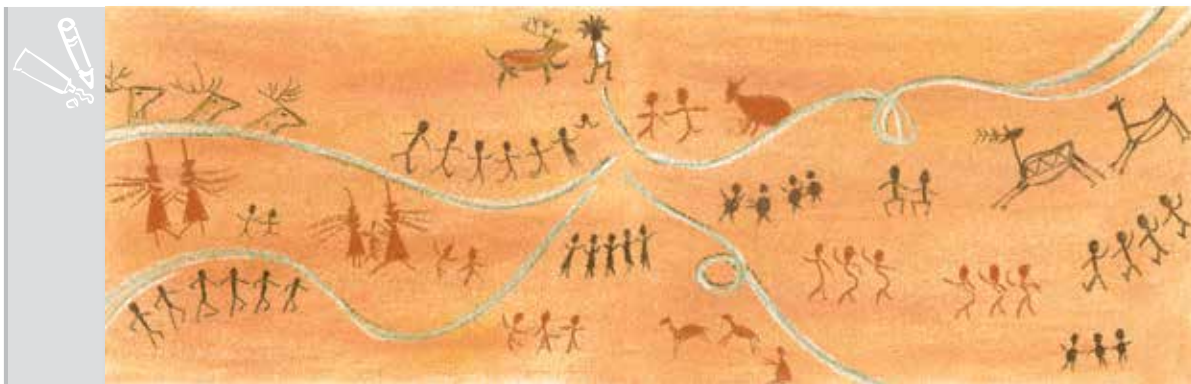
Figura 6: Embalados pela música, grupos diversos se organizam em danças, rituais e celebrações (p. 34-35).

Inúmeros aspectos desse fascinante tema podem ser abordados com diferentes faixas etárias, conjugando-se a discussão e a reflexão sobre o tema com a prática musical baseada na história. As seguintes sugestões têm complexidade cumulativa por segmento escolar: os segmentos finais incorporam as atividades e discussões dos anteriores.