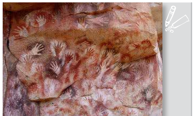
Figura 7: “Mãos em negativo”, Cova das Mãos, Santa Cruz, Argentina. Entre 13.000 e 9.500 a.C.