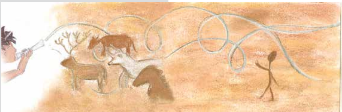
Figura 5: O som da flauta atrai animais e um indivíduo (p. 26-27).