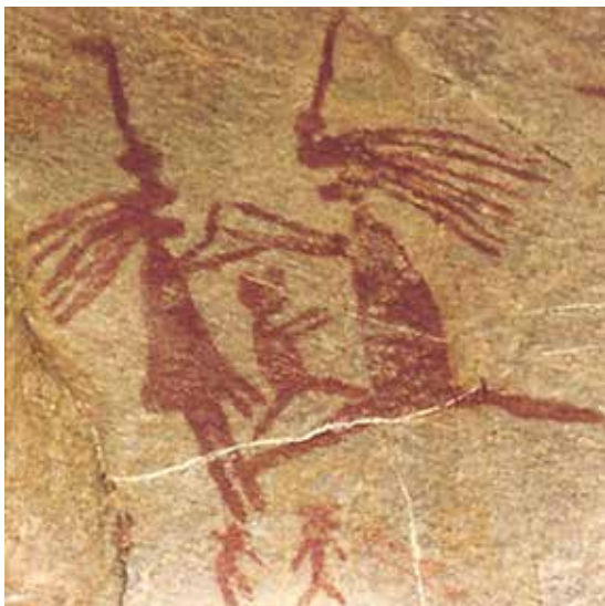
Figura 8: Ritual, jogo ou dança? - Sítio de Xique-Xique IV, Serido, RN.

A riqueza de possibilidades que esse tema suscita é inquietante. Reconhecer sua dimensão interdisciplinar é inevitável, dada a inserção da música na vida e na cultura que nos faz humanos. Os focos cruzados das diversas disciplinas podem projetar uma imagem mais nítida do surgimento da música e seu significado, numa perspectiva mais abrangente e menos fragmentada do fenômeno. A educação musical só tem a ganhar ao oferecer oportunidades para o enriquecimento do espírito humano que, em sua essência, desconhece fronteiras entre cultura, arte, música e vida. Para tanto, é preciso abandonar a visão dogmática que tende a desconectar a música da vida e passar a considerar a multidimensionalidade da vida onde ela se insere e que nela se encerra.