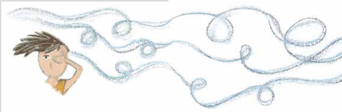
Figura 3: O menino observa a natureza e percebe o efeito do vento (p. 16-17).